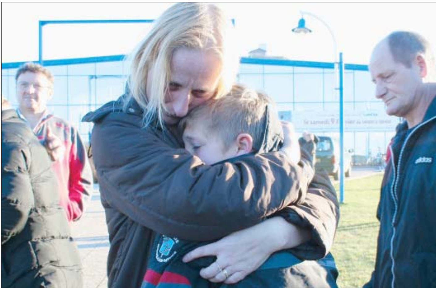
Les enfants revenaient de classe de neige à Valloire en Savoie.

Alors que Nicolas Sarkozy a affiché vendredi l'ambition de « réinventer la ville », à Roubaix comme à Lens, habitants et acteurs de terrain dressent l'état des lieux. > PAGES 2-3, NOTRE ENTRETIEN AVEC AXIOM ET L'ÉDITO EN 4